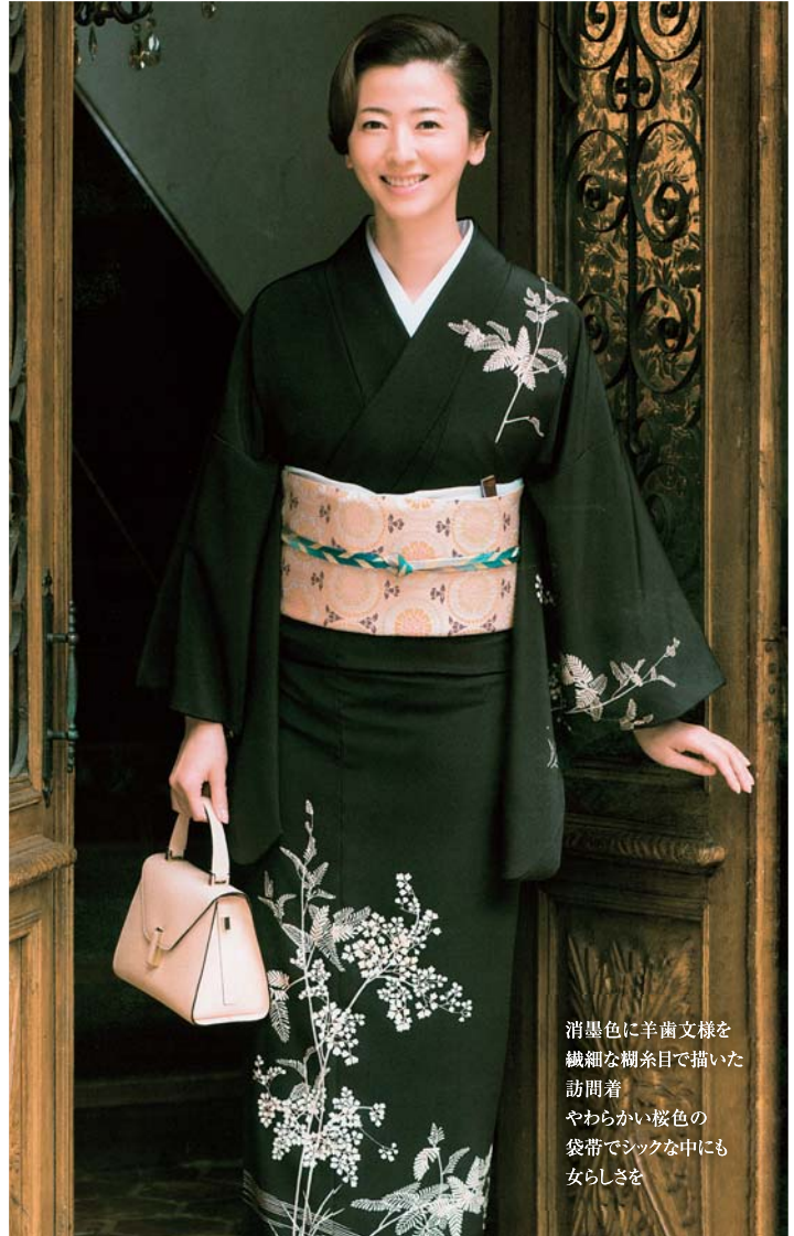
消墨色に羊歯文様を 繊細な欄糸目で描いた 訪問着 やわらかい桜色の 袋帯でシックな中にも 女らしさを