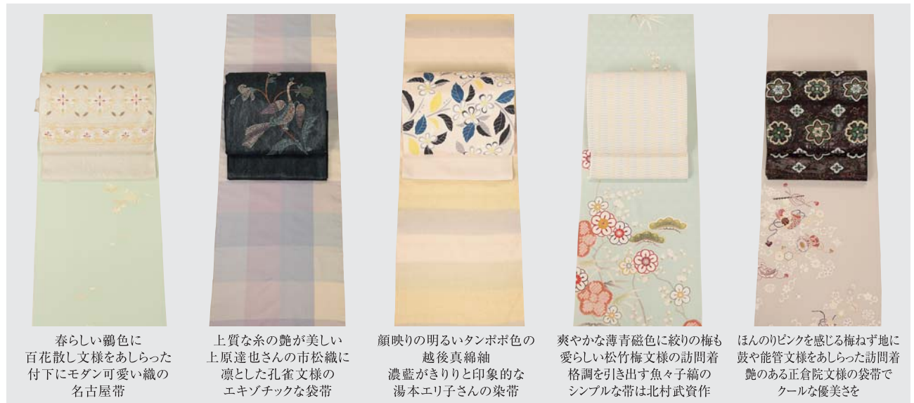
春らしい鶯色に 百花散し文様をあしらった 付下にモダン可愛い織の 名古屋帯

●阪急豊中駅から徒歩4分 〒560-0021 豊中市本町4-1-8 http://www.orimoto-t.co.jp TEL 06-6849-5298(代) FAX 06-6852-1021