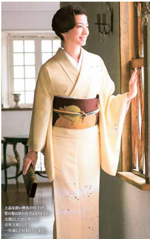
上品な淡い卵色の付下げ、帯の菊は秋の花ではありますが文様としては古典的な吉祥文様として、一年通して好まれています。