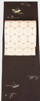
織元オリジナルの濃い色の優しい付下げ小紋に大人っぽいピンクの袋帯