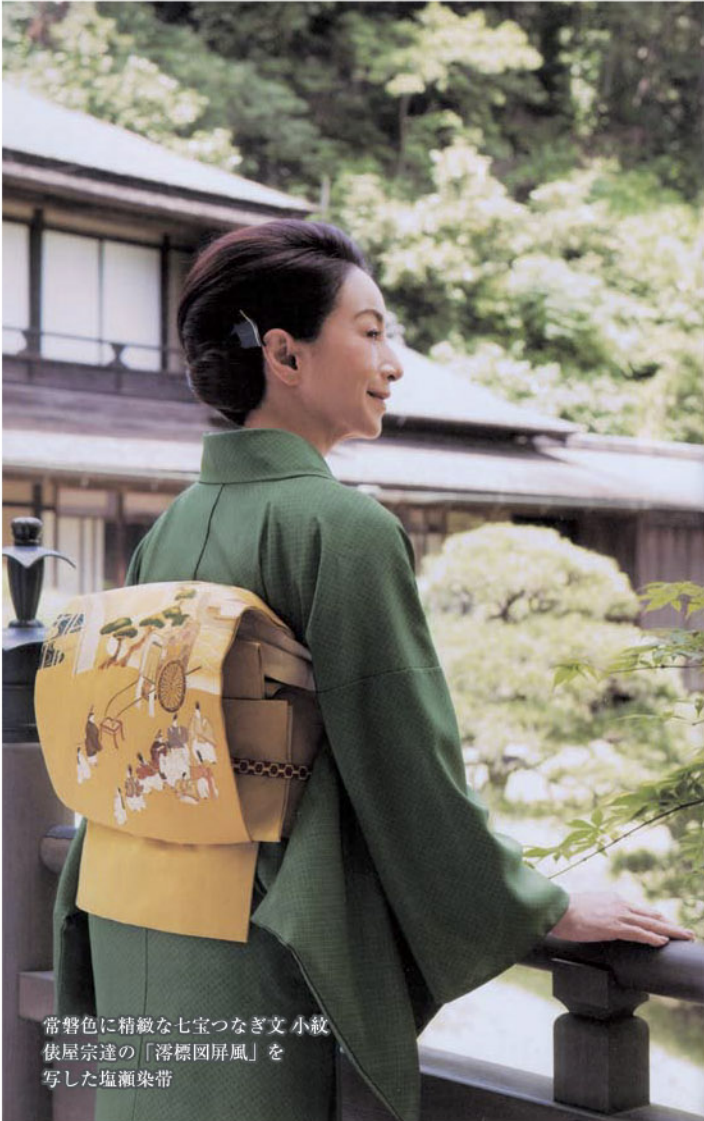
常磐色に精緻な七宝つなぎ文 小紋 俵屋宗達の「落標図屏風」を 写した塩瀬染帯