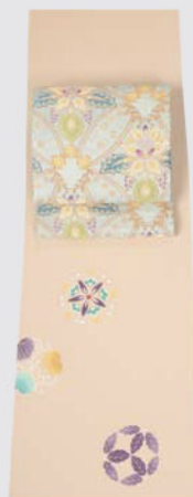
差し色が印象的な 付下げに アールヌーボーを 思わせる袋帯