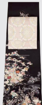
こっくりした紫に 優雅な茶屋辻文様 訪問着 品格のある大人ピンクの 北村武資 袋帯