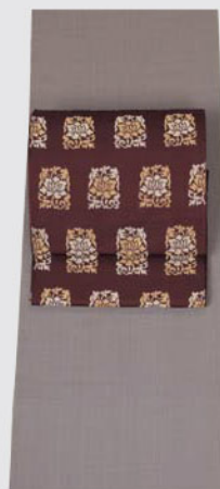
椎の灰、まだみの赤の光沢が 奥深い山下黄八丈 凜とした龍村袋帯 洗練されたシックな装い