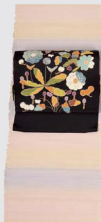
はんなりやさしい 手織りの飯田紬 辻花文様をモダンに アレンジしたちりめん染帯

〒560-0021 豊中市本町4-1-8 http://www.orimoto-t.co.jp TEL 06-6849-5298(代) FAX 06-6852-1021