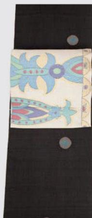
トルコブルーの紋りが アクセントの焦茶紬 インド更紗 織名古屋帯で 軽妙洒脱に