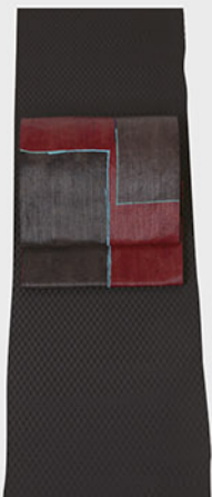
艶が映える他に顔を見ない情緒ある黒八丈にモダンアートを想起させる漆箔の静かな光沢が美しい袋帯で