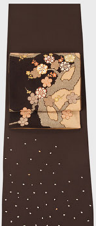
蒔糊の洒脱な付け下げは帯合わせもいろいろ楽しめます。桃山小袖の写しの帯を合わせて時代のクロスオーバーを感じて