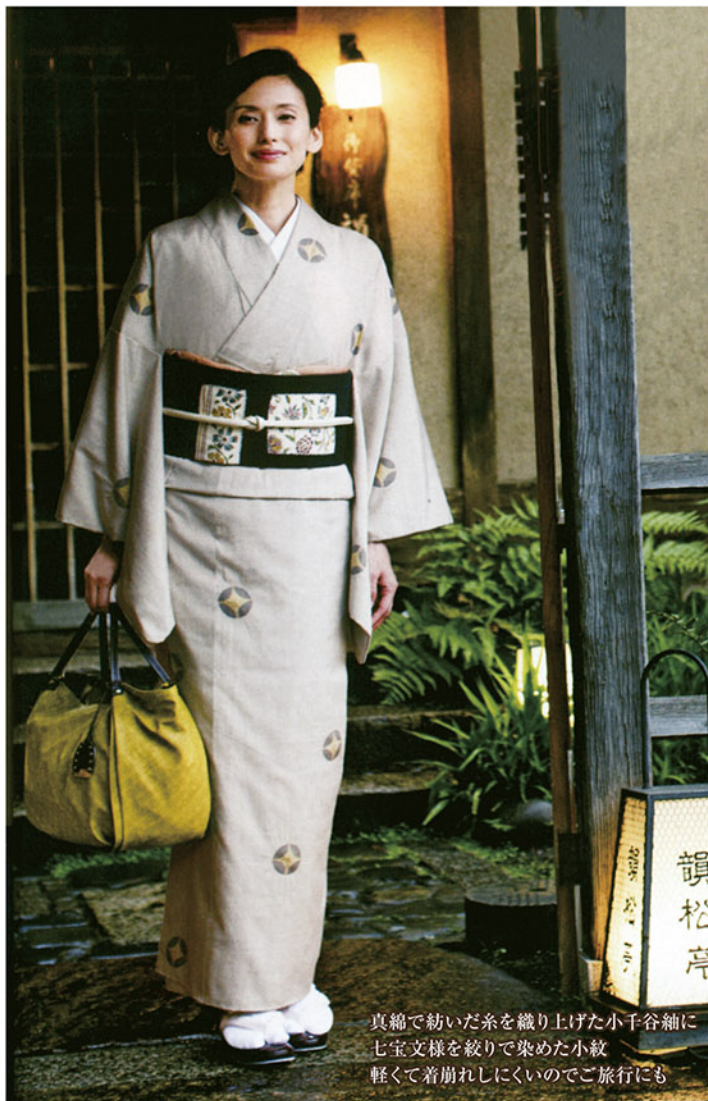
真綿で紡いだ糸を織り上げた小千谷紬に七宝文様を絞りで染めた小紋。軽くて着崩れにくいのでご旅行にも