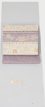
爽やかなブルーグレイに繊細な扇面文様が優しい付け下げに織り感の豊かなきれいな色の袋帯をコーディネート