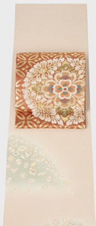
お顔を晴れやかに彩る東雲色に宝尽くしの付け下げ華麗な箔を使った宝相華文様袋帯で優美な風情を