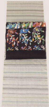
林郁作段ぼかし 吉野織着尺に 添田敏子の型絵染帯