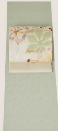
地紋が華やかな若草色に 筆致を感じる 大きな草花文の染め袋帯