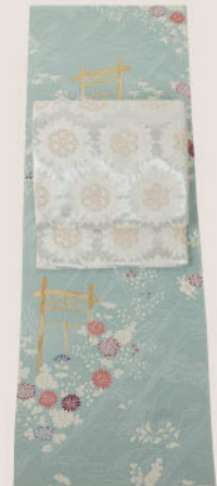
御所解文の クラシカルな付下に 北村武資の精微な袋帯