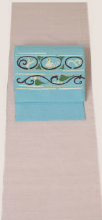
梅と西洋茜の 草木染飯田紬に 色あいが楽しいすくい帯

今回、素敵な色合いの着物に出会えて 本当に良かったです。 これを着て成人式を迎える事がとても楽しみです。