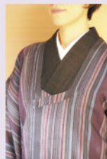
やさしく変わり襟