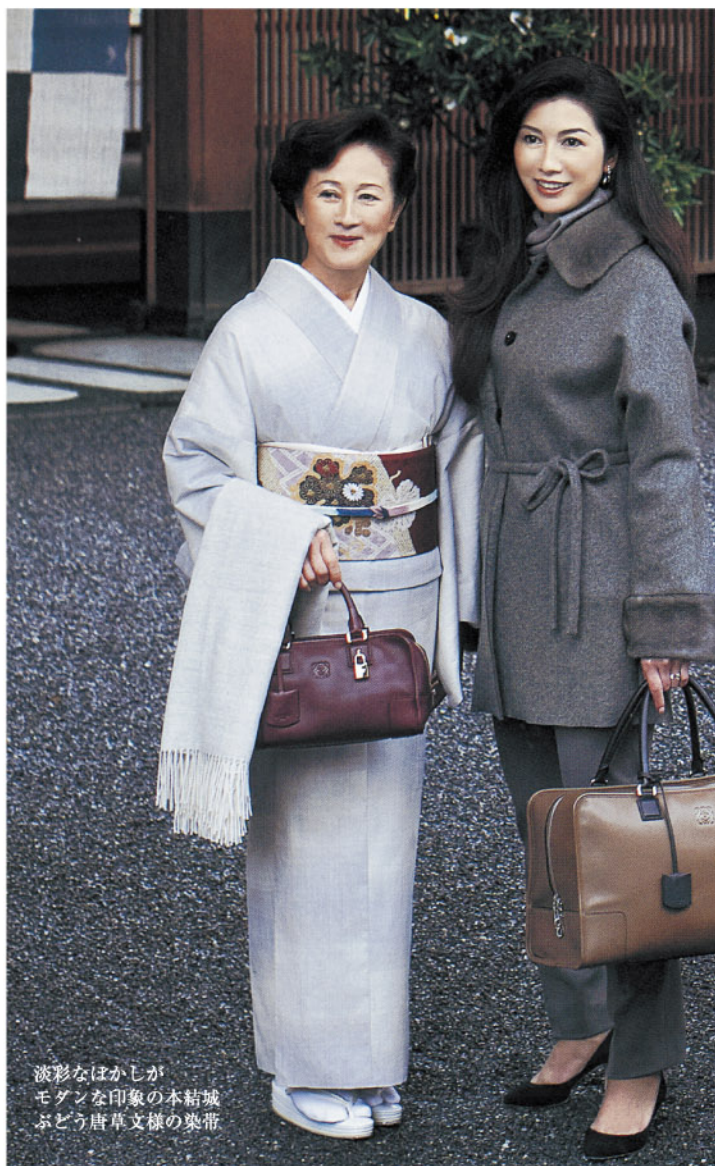
淡彩なほかじが モダンな印象の本結城 ぶどう唐草文様の染帯