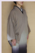
すっきりきもの型