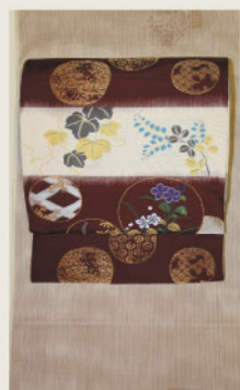
あみほかじに亀甲緋で 色紙を表した贅沢な本結城 大胆な古典柄のしゃれ袋帯