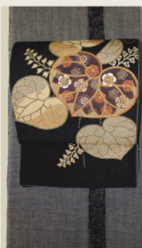
「一本独鈷」と呼ばれる、 すっきりと都会的な本結城 疋田を葵に忍ばせた小袖を 彷彿とさせるクラシックな染袋帯