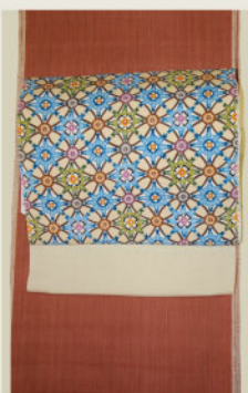
細かい縞の大人の女らしい 茜色の本結城 玉那覇有公の紅型染帯