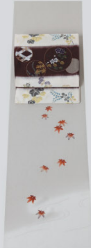
流水ほかしの楓散しの付下 古典柄でありながら個性的な 段替草花小袖文袋帯