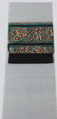
やわらかいグレーの 格子 飯田袖 表情豊かな更紗染帯