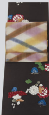
辻が花ちりめん小紋 巧みな技が光る 池田リサ作板締緋帯