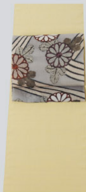
檸檬色上田袖 季節が薫る菊文染帯