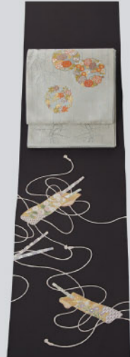
雅な笛袋に紐の付下 やさしい白藍色の 花丸文袋帯