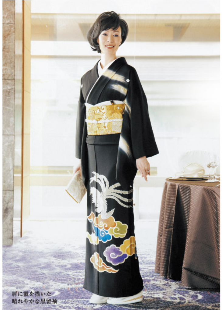
肩に霞を描いた 晴れやかな黒留袖

ご自身の寸法をご存知でしょうか。 同じ身長でも肩のライン、腰ひもの位置、 帯結びの高さなどで寸法は微妙に違ってきます。 ぴったりとお体に合った寸法で仕立てたお着物だと 長時間お召しになっていても着くずれもなく すっきりと楽に着こなしていただけます。 譲り受けたもの、数十年前につくられたものでも 仕立て替えや、寸法直しでお体に添わせることが できます。 織元では、お客様の体型と、着付の好み、 目的（お茶、日舞・・・）に合わせて、お一人お一人 丁寧に寸法を割り出し、お仕立てさせていただいて おります。 美しく気持ちよくお着物をお召しになって 着物での日々をより心豊かにお過ごしくださいませ。