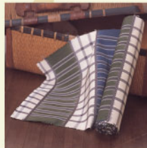
格子名古屋帯 柳宗