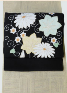
あじろ小紋に ちりめん染帯