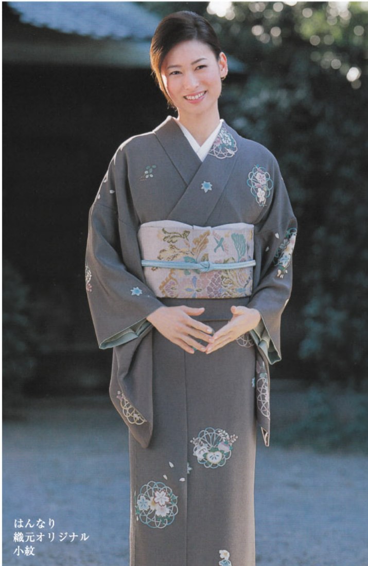
はんなり 織元オリジナル 小紋