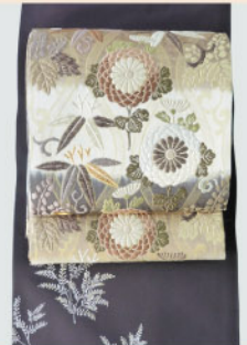
しだ柄付けに 織袋帯