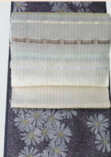
菊柄大島紬に 吉野間道の帯