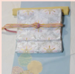
卒業式、お茶会に ぴったりの付下げが 207,900円で