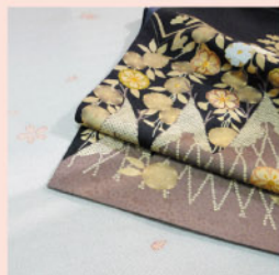
ちりめん桜小紋に 桜の帯で お花見に