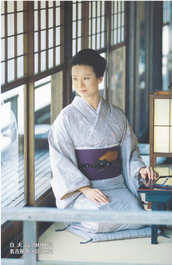
白大島 294,000円 名古屋帯 157,500円