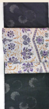
更紗の帯で シックに