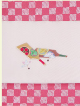
小紋に 羽子板の染帯