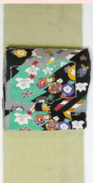
個性的な地色に 女流作家の名古屋帯