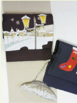
さめ小紋に ガス燈の染帯