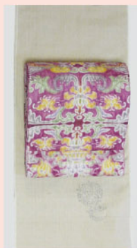
とび柄に 瀬織の袋帯