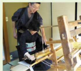
昨年も大好評でした。

1500年前から続い ている腰の力で 縦糸の張りを調節 する地機を本場より お持ちしました。