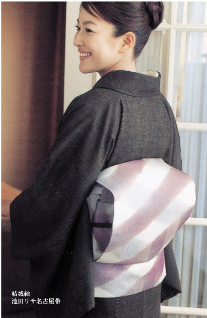
結城紬 池田リサ名古屋帯