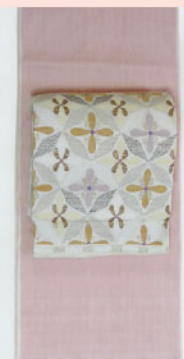
ピンクの無地に おしゃれ袋帯