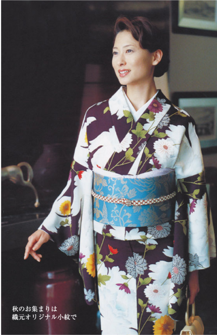
秋のお集まりは 織元オリジナル小紋で