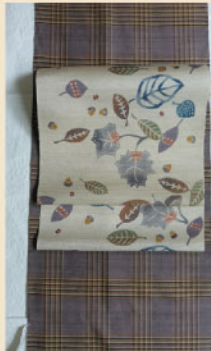
格子の紬に どんぐりの名古屋帯