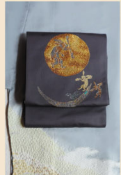
おぼろ染めの訪問着に 月とうさぎの袋帯