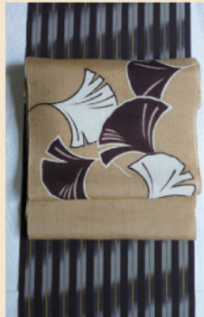
縞のお召しに いちようの名古屋帯