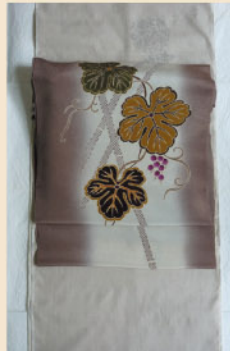
白茶とび柄の紬に 葡萄の名古屋帯