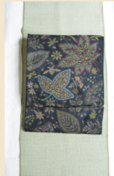
あられ模様のちりめん小紋に 秋の葉の袋帯