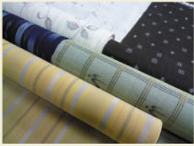
小千谷ちぢみ、能登上布、琉球紼、夏紅花・・・