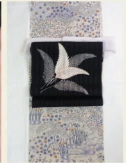
付け下げで涼感を