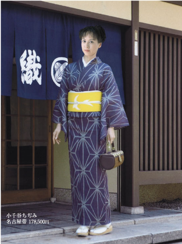
小千谷ちぢみ 名古屋帯 178,500円